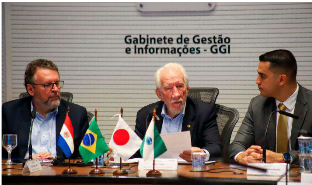
Vice-governador Darci Piana, no Palácio Iguaçú.

A meta é reduzir as perdas de água do Paraguai de 45% para 35% em três anos, tomando como modelo o desempenho da Sanepar, que registra 34%, abaixo da média nacional de 40%. O convênio prevê capacitação técnica, troca de experiências e transferência de