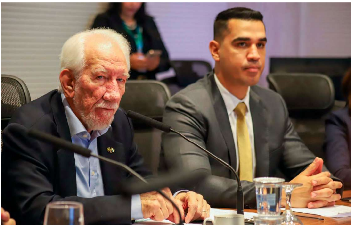
Vice-governador Darci Piana, no Palácio Iguazu.