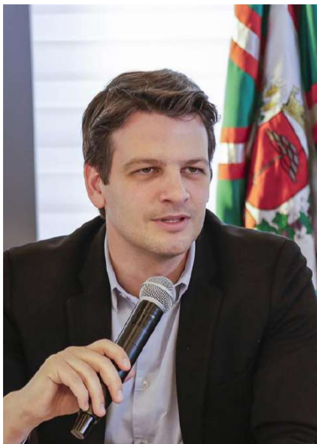
Prefeito Eduardo Pimentel

A Prefeitura de Curitiba e instituições da sociedade civil formalizaram, nesta quarta-feira (22/10), um protocolo de intenções para uma campanha educativa sobre como ajudar, de forma efetiva e segura, pessoas e famílias em situação de vulnerabilidade social, entre elas as que estão em situação de rua. A assinatura do documento aconteceu em uma reunião na sede da Associação Comercial do Paraná (ACP). “Pra a ajuda durar, mude o jeito de ajudar.” Esse é o slogan da nova campanha, que convida os curitibanos a refletirem sobre o impacto real das doações e a adotarem práticas de solidariedade mais estruturadas e transparentes. A proposta é clara: ajudar, sim — mas do jeito certo.