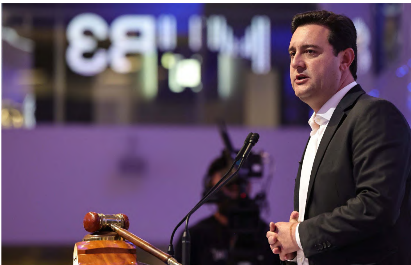
Governador Carlos Massa Ratinho Junior, que acompanhou o leilão na B3