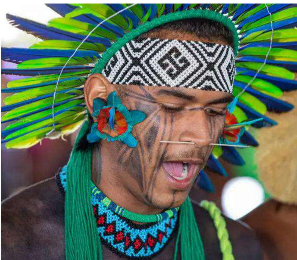
Censo revela que 1.694.836 pessoas indígenas vivem em 4.833 municípios do país