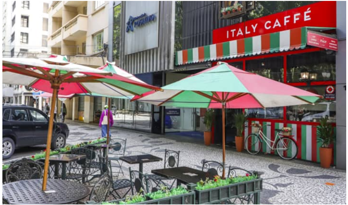
Pesquisa do Inpespar revela aumento nas locações comerciais, impulsionado por ações de revitalização do Centro. Curitiba, 21/01/2026.