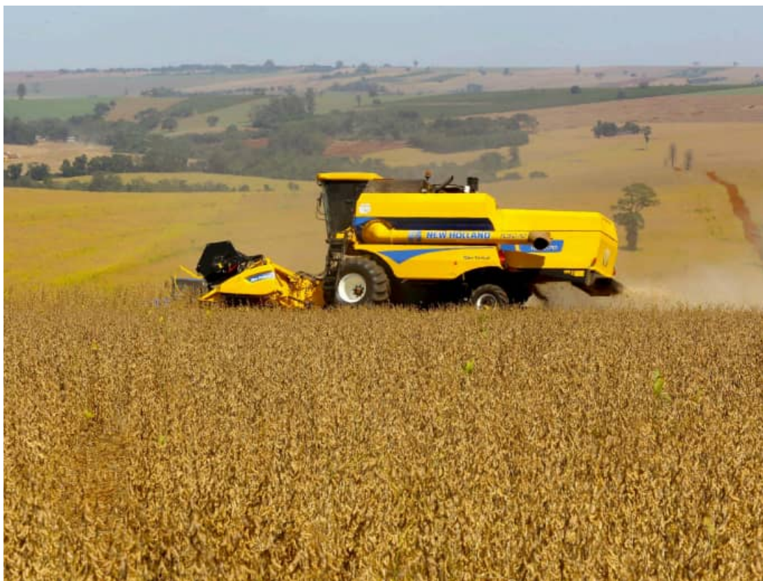
Boletim do Deral aponta que safra 2026 ganha volume e consolida cenário positivo no Paraná