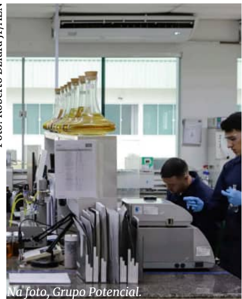
Na foto, Grupo Potencial.